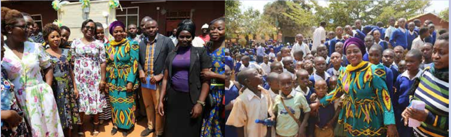
Naibu Waziri wa Nishati, Subira Mgalu (mwenye kilemba) akiwa pamoja na Walimu na Wanafunzi wa Shule ya Msingi Mazae iliyopo wilayani Mpwapwa, Mkoa wa Dodoma, mara baada ya kuwasha umeme katika Shule hiyo, Agosti 13, 2020.