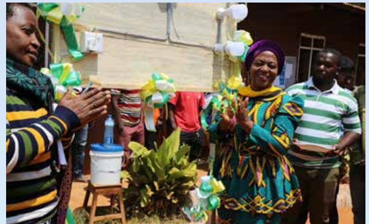
Naibu Waziri wa Nishati, Subira Mgalu (mwenye kilemba) akiwa mwenye furaha, mara baada ya kukata utepe kuwashiria kuwashwa kwa umeme katika Kijiji cha Mazae, Wilaya ya Mpwapwa, mkoani Dodoma, Agosti 13, 2020.