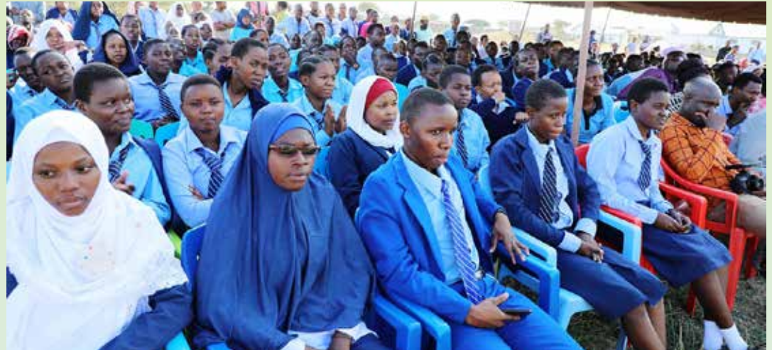
Sehemu ya umati wa wanafunzi wa Chuo cha Ualimu Mong'are, wilayani Hai, wakimsikiliza Waziri wa Nishati Dkt Medard Kalemani. Waziri aliwasha rasmi umeme katika Chuo hicho Agosti 17, 2020 akiwa katika ziara ya kazi.