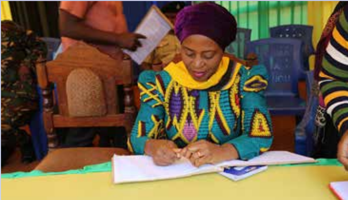
Naibu Waziri wa Nishati, Subira Mgalu akisaini kitabu cha wageni mara baada ya kuwasili katika Kijiji cha Mazae, Wilaya ya Mpwapwa, mkoani Dodoma, Agosti 13, 2020.