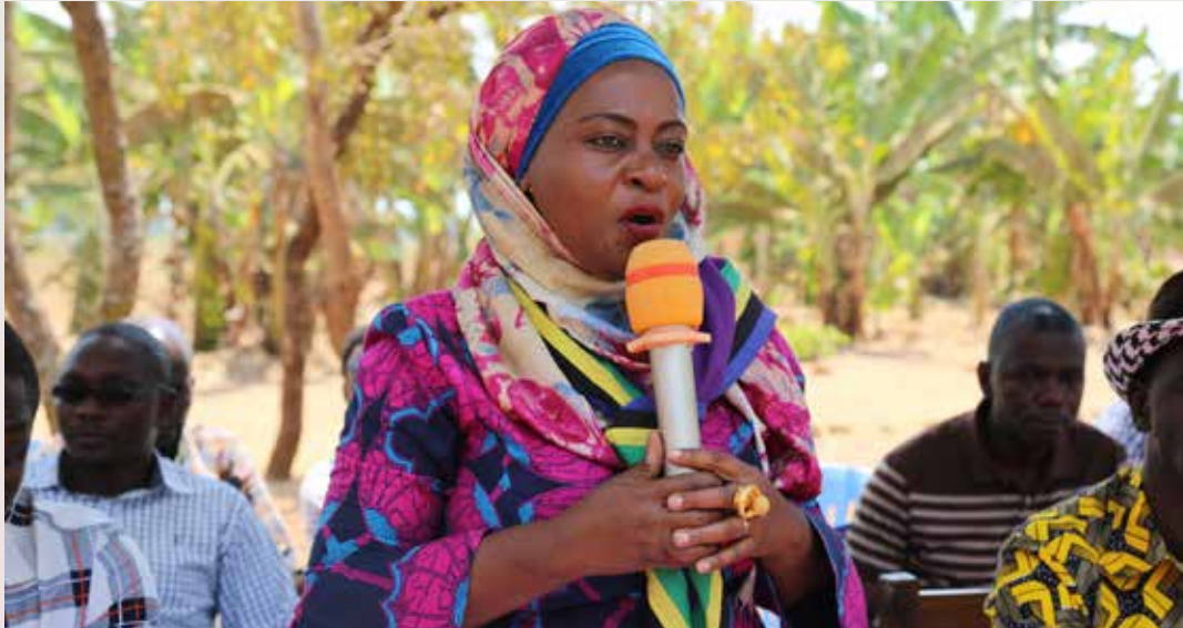
Naibu Waziri wa Nishati, Subira Mgalu, akizungumza na wananchi wa kijiji cha Namonge, Kata ya Namonge, Wilaya ya Bukombe, Mkoani Geita, kabla ya kuwasha umeme kwenye kijiji hicho, Agosti 17, 2020.