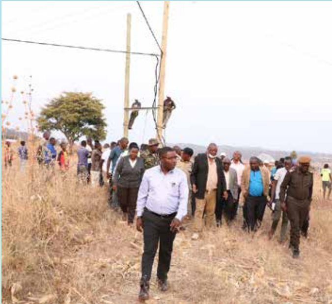
Waziri wa Nishati Dkt Medard Kalemani (mbele), akikagua maendeleo ya utekezaji wa Mradi wa Umeme Vijijini Awamu ya Pili (REA II), kijiji cha Kisiriri, wilayani Iramba, Mkoa wa Singida, Agosti 13, 2020.