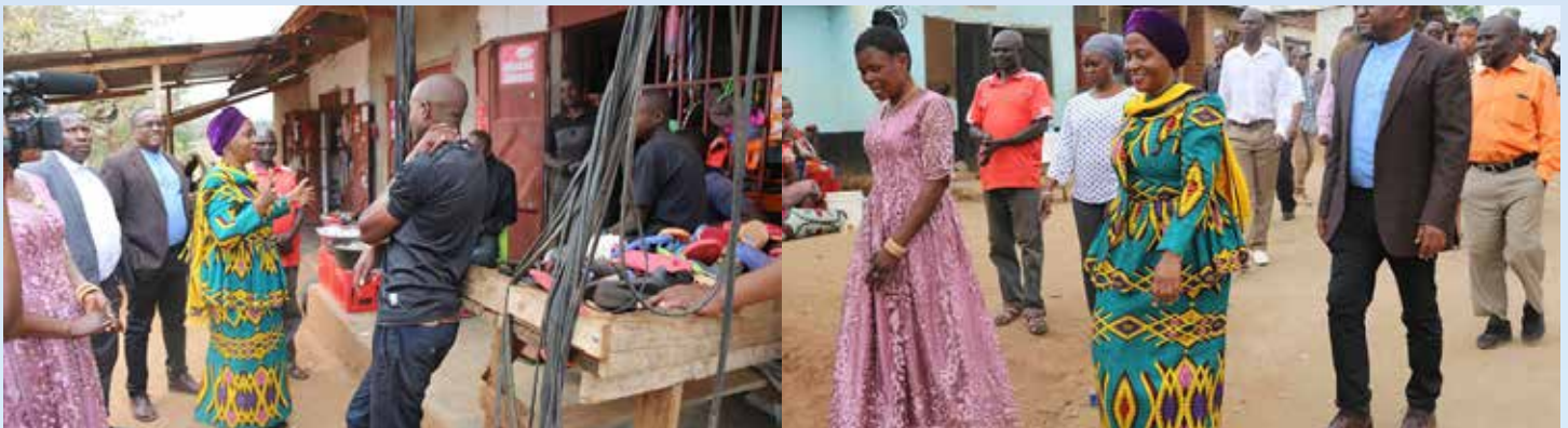
Naibu Waziri wa Nishati, Subira Mgalu (mwenye kilemba) akiwa pamoja na viongozi mbalimbali wa Mkoa wa Morogoro wakati wa ziara ya ukaguzi wa kazi ya usambazaji umeme katika maeneo mbalimbali ya Kijiji na Kata ya Lumuma, Wilaya ya Kilosa, mkoani Morogoro, Agosti 13, 2020.

Katika ziara hiyo, Naibu Waziri pia alikagua kazi ya usambazaji umeme katika Wilaya ya Kilosa, mkoani Morogoro na kuwasha umeme katika kijiji cha Lumuma na baadaye kugagua umeme katika makazi na maeneo ya biashara.