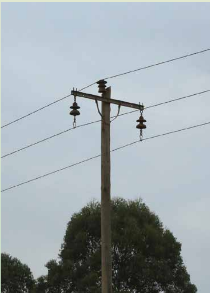
Moja ya nguzo zinazotumika kusambaza umeme unaozalishwa na Kampuni ya Andoya kwa kutumia maporomoko ya maji ya mto Mtandazi, wilayani Mbinga, Mkoa wa Ruvuma.