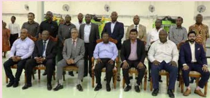
Waziri wa Nishati Dkt Medard Kalemani (katikati-waliokaa), akiwa katika picha ya pamoja na Viongozi pamoja na Wafanyakazi wa Kiwanda cha Inhemeter kitakachokuwa kikizalisha viunganishi vya mifumo ya umeme. Waziri Kalemani alifungua kiwanda hicho Agosti 10, 2020 Kinondoni, jijini Dar es Salaam.