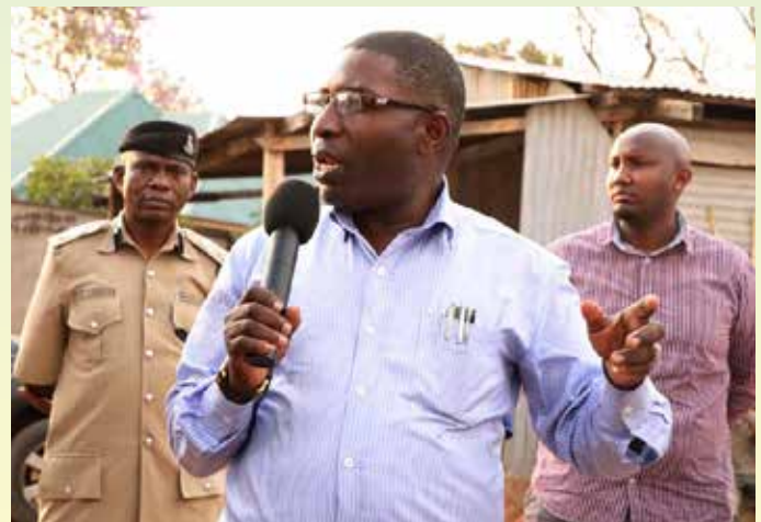
Waziri wa Nishati Dkt Medard Kalemani, akizungumza na wananchi wa kijiji cha Kisiriri, wilayani Iramba, Mkoa wa Singida (hawapo pichani), alipokuwa katika ziara ya kazi kukagua utekezaji wa Mradi wa Umeme Vijijini Awamu ya Pili (REA II), Agosti 13, 2020.