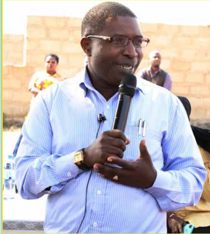
Waziri wa Nishati Dkt Medard Kalemani, akizungumza na wananchi wa kijiji cha Lendikinya, Kata ya Sepeko, wilayani Monduli, Mkoa wa Arusha (hawapo pichani), alipokuwa katika ziara ya kazi kukagua utekelezaji wa miradi ya umeme vijijini, Agosti 15, 2020.

Dkt Kalemani alilazimika kutoa maelekezo hayo baada ya kukagua maendeleo ya utekelezaji wa kazi husika katika maeneo kadhaa ya Wilaya hiyo, ambapo alibaini kuwa Mkandarasi husika