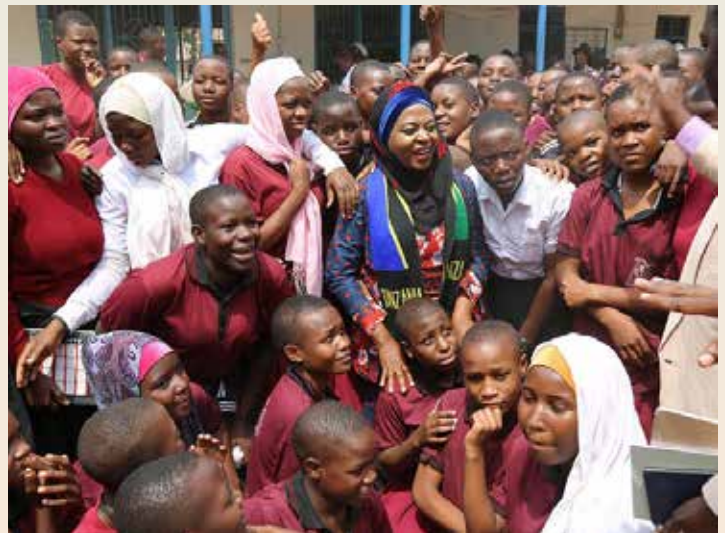
Naibu Waziri wa Nishati, Subira Mgalu akiwa katika picha ya pamoja na wanafunzi wa Shule ya Sekondari Imalilo, iliyoopo katika Kijiji cha Kibitilwa, Kata ya Ilula, Wilaya ya Kwimba, akiwa kwenye ziara ya ukaguzi wa kazi za usambazaji umeme vijijini, Agosti 15, 2020.