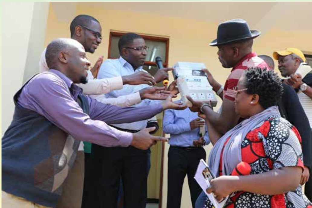
Waziri wa Nishati Dkt Medard Kalemari (katikati), akiwakabidhi Waandishi wa Habari, Mkoa wa Arusha, vifaa vya Umeme Tayari (UMETA), ili waunganishiwe katika nyumba zao. Waziri alikuwa katika ziara ya kazi kukagua miradi mbalimbali ya umeme wilayani Arusha, Agosti 16, 2020.