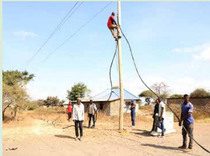
Baadhi ya Vibarua wa Mkandarasi anayetekeleza Mradi wa Umeme Vijijini wilayani Hai, Mkoa wa Kilimanjaro wakiendelea na kazi katika Kitongoji cha Kambi ya Nyuki, wakati wa ziara ya Waziri wa Nishati Dkt Medard Kalemani wilayani humo, Agosti 17, 2020.

“Ninaagiza Wakandarasi hawa wakiwemo Wakurugenzi wao, wote wasiondoke hapa Hai hadi