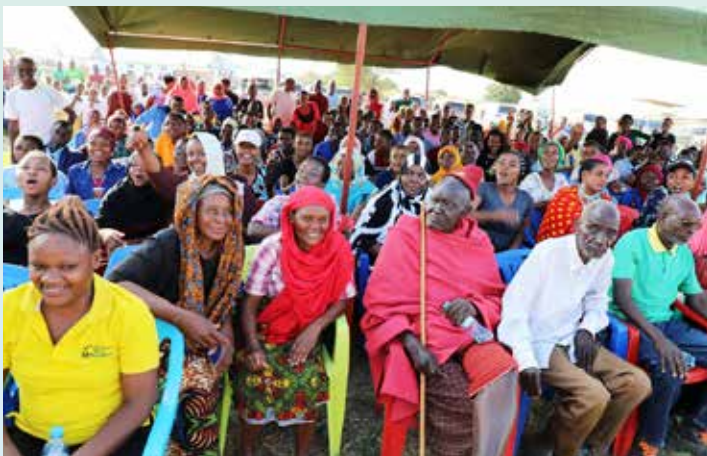
Sehemu ya umati wa wananchi wa Kitongoji cha Kambi ya Nyuki, wilayani Hai, wakimsikiliza Waziri wa Nishati Dkt Medard Kalemani, alipozungumza nao kabla ya kuwasha rasmi umeme katika Chuo cha Ualimu Mong'are, wilayani humo, Agosti 17, 2020 akiwa katika ziara ya kazi.

Timu iliyoungwa inajumuisha wataalamu kutoka Wizara ya Nishati, TANESCO Makao Makuu na Wakala wa Nishati Vijijini (REA) Makao Makuu.